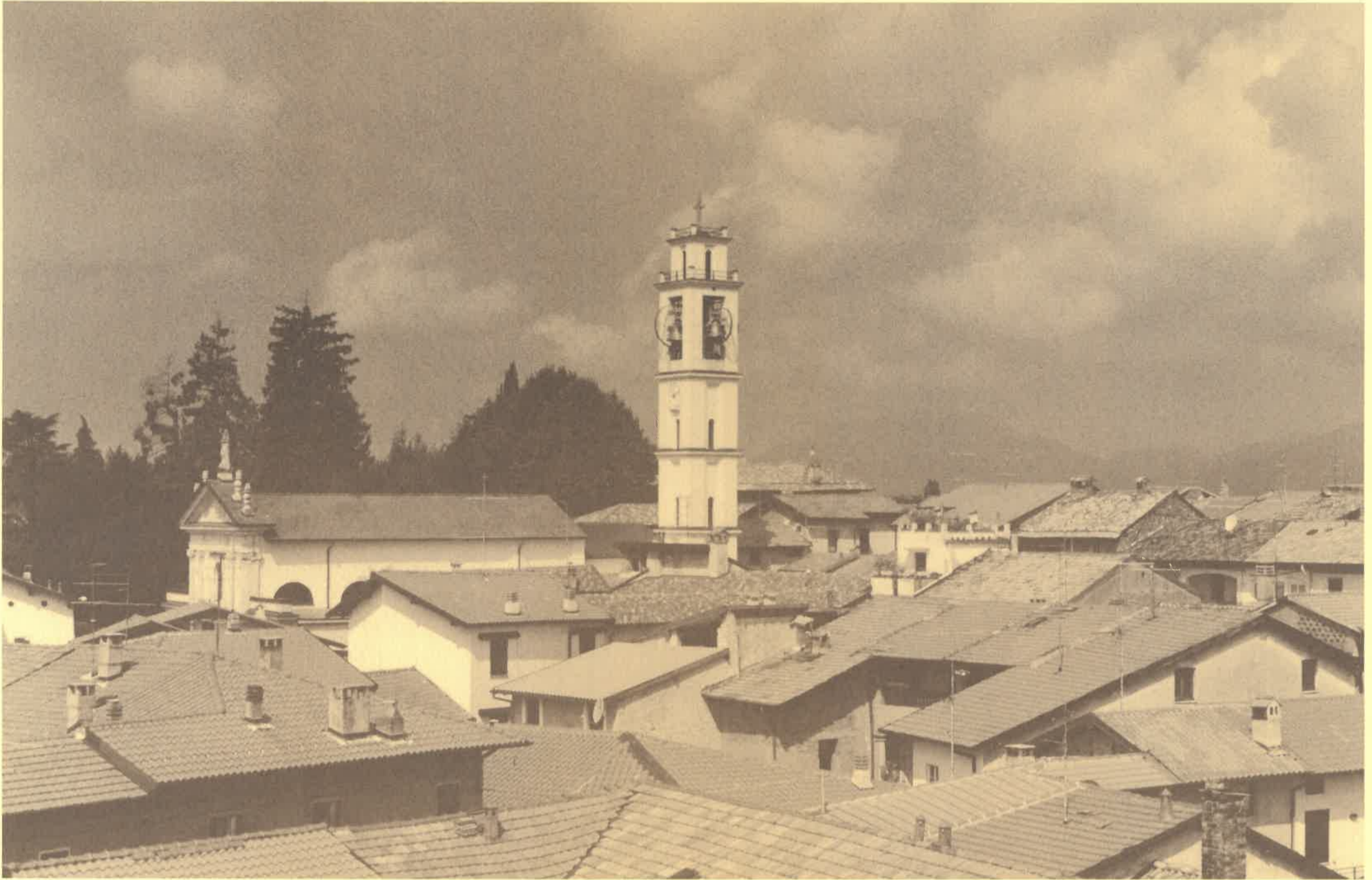
Una suggestiva "veduta" dall'alto