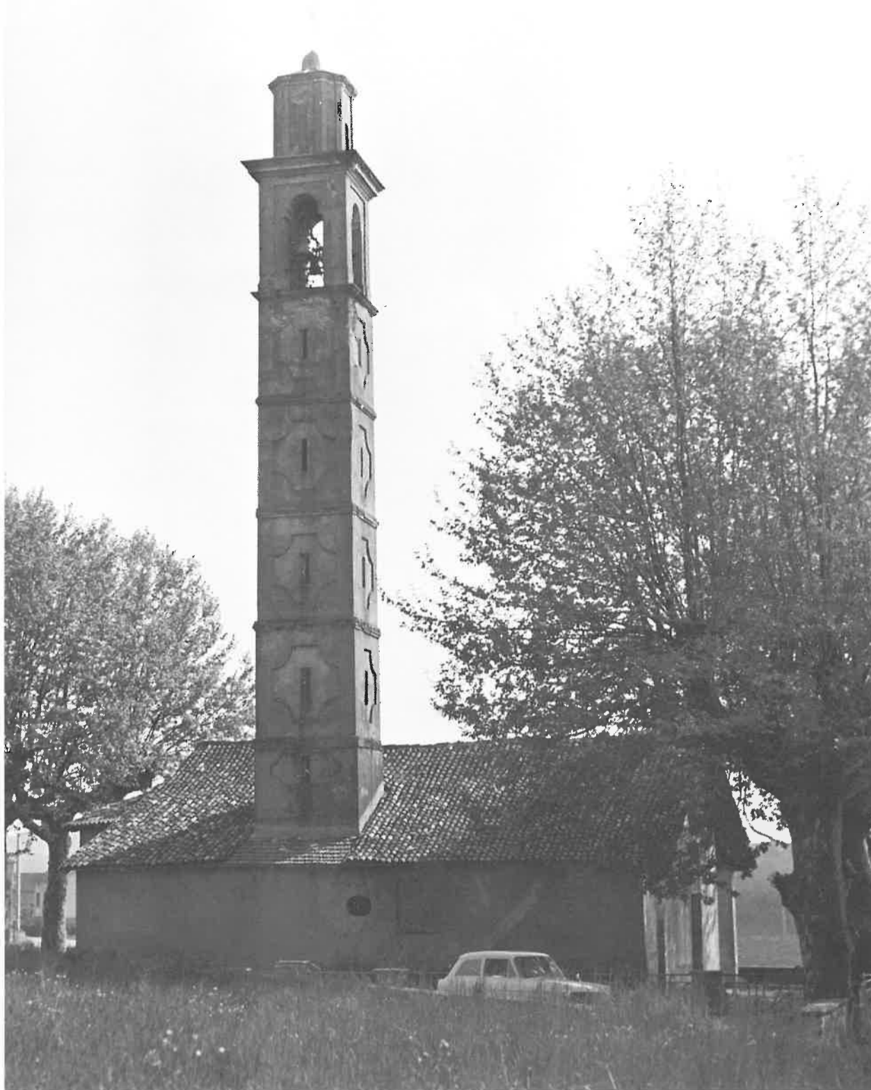
Facciata Nord con il campanile. Ieri...