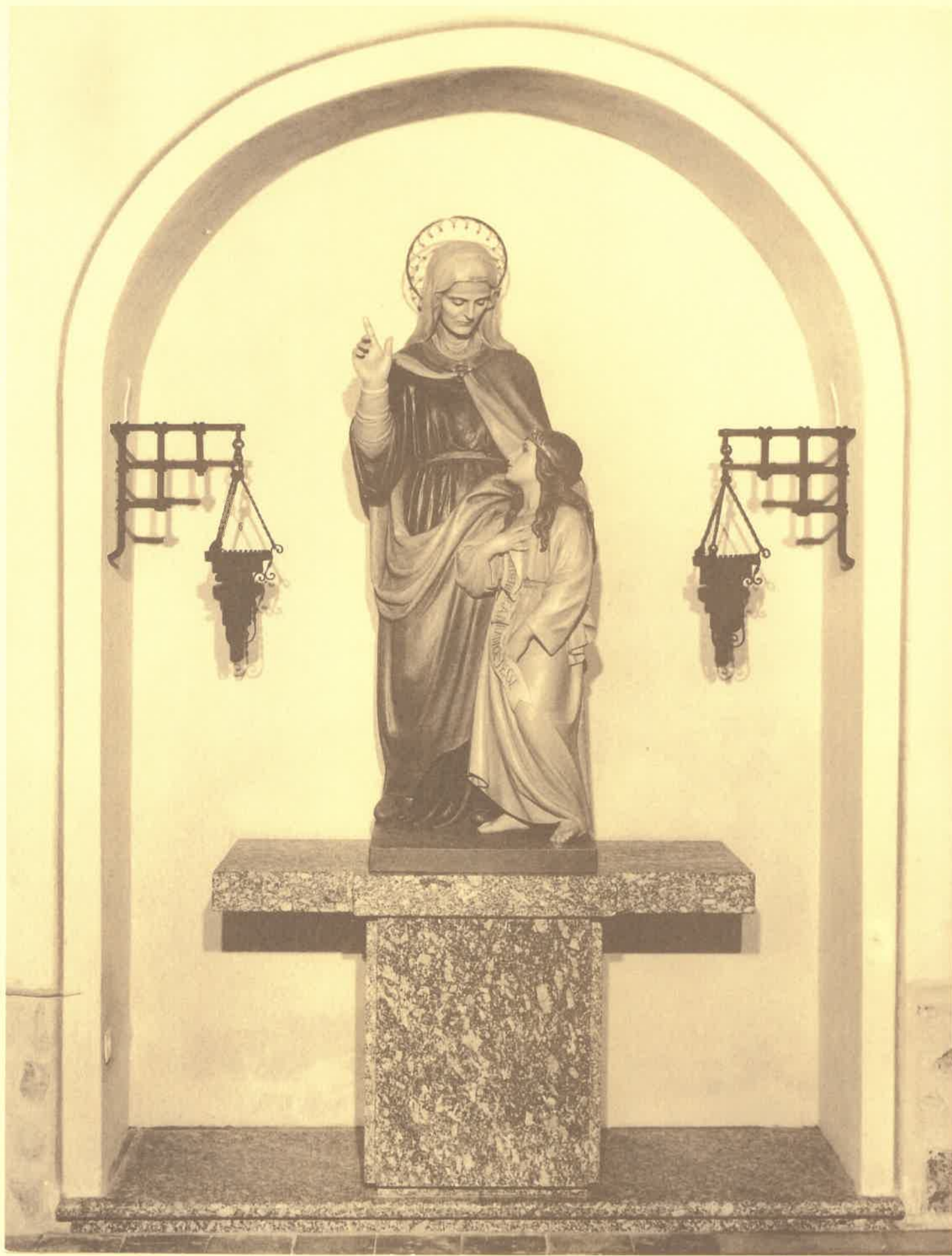
Statua di S. Anna (Oratorio di S. Martino) Albiolo