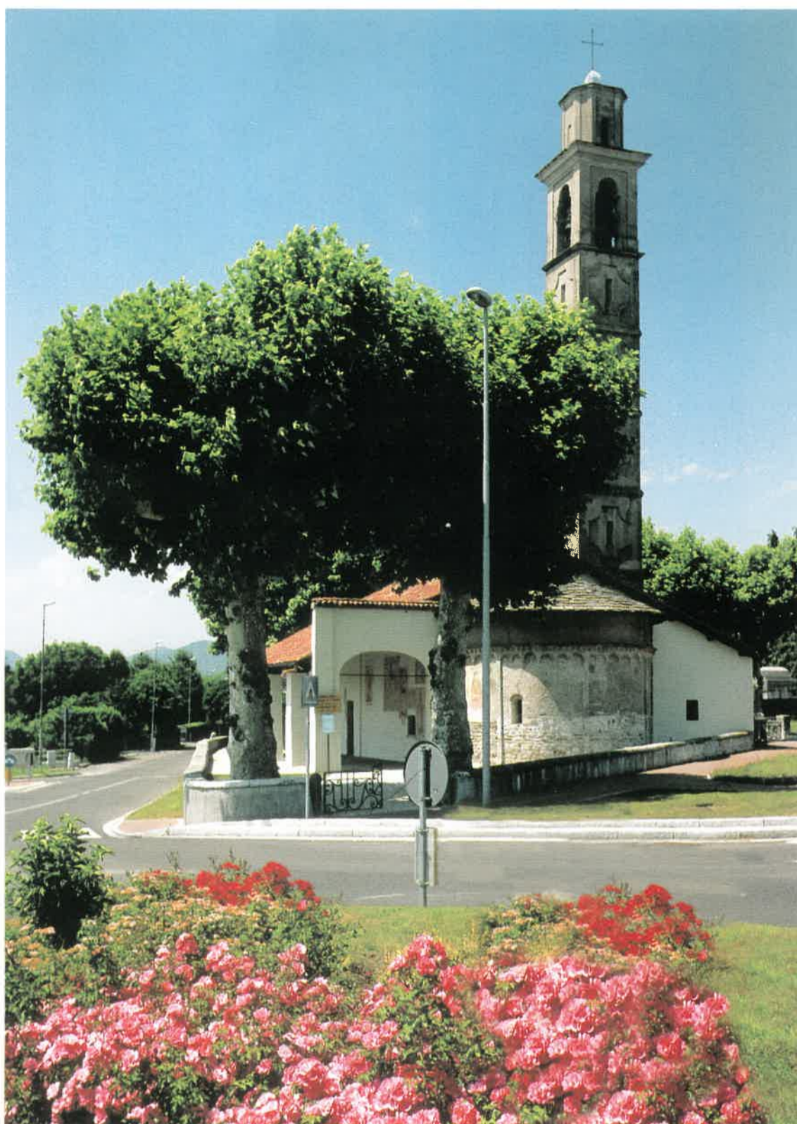
Veduta dell'abside. Oggi: con le rotonde e le aiuole che valorizzano la bellezza della costruzione.