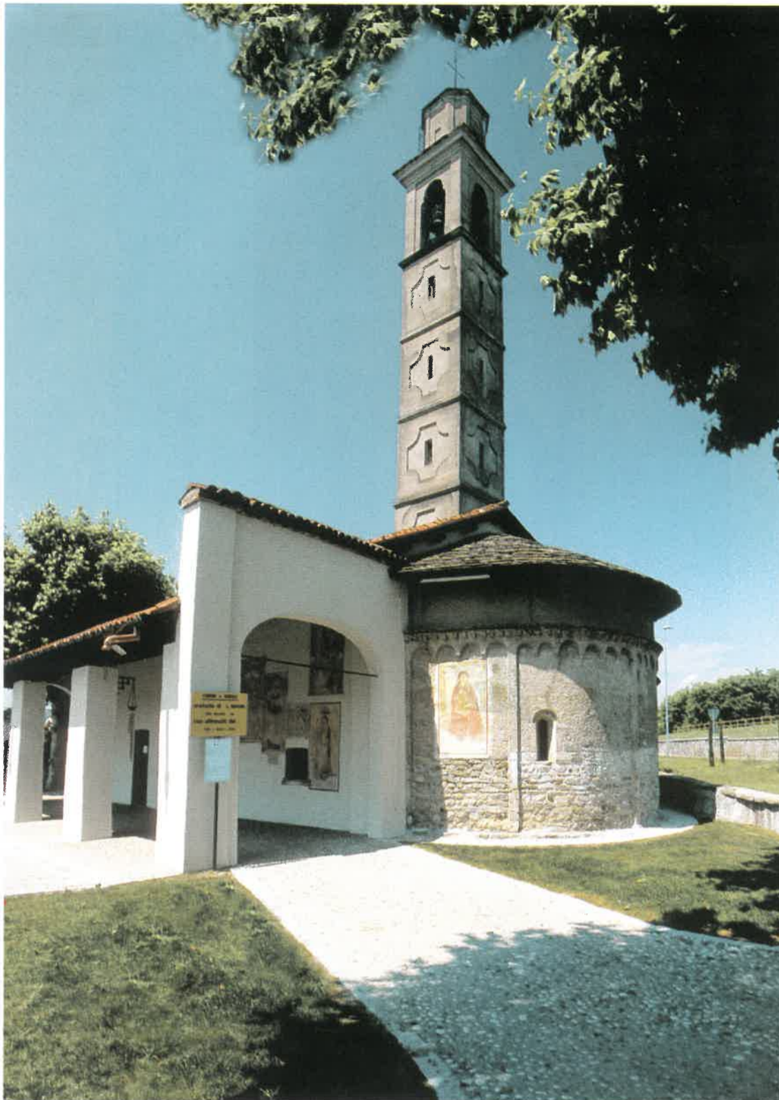
Veduta est con l'abside, il porticato e il settecentesco campanile. Oggi: dopo il restauro dell'affresco, le monofore riportate alla luce, la pavimentazione circostante.