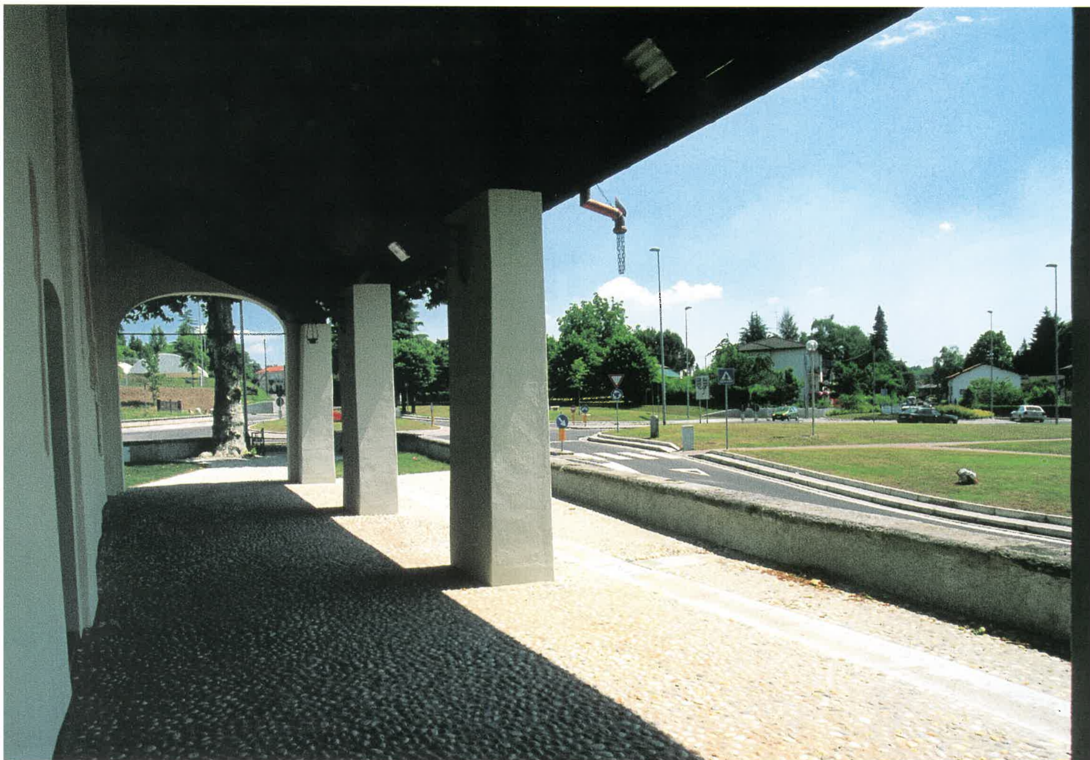
Porticato sud. Oggi: dopo la sistemazione del verde e delle rotonde.