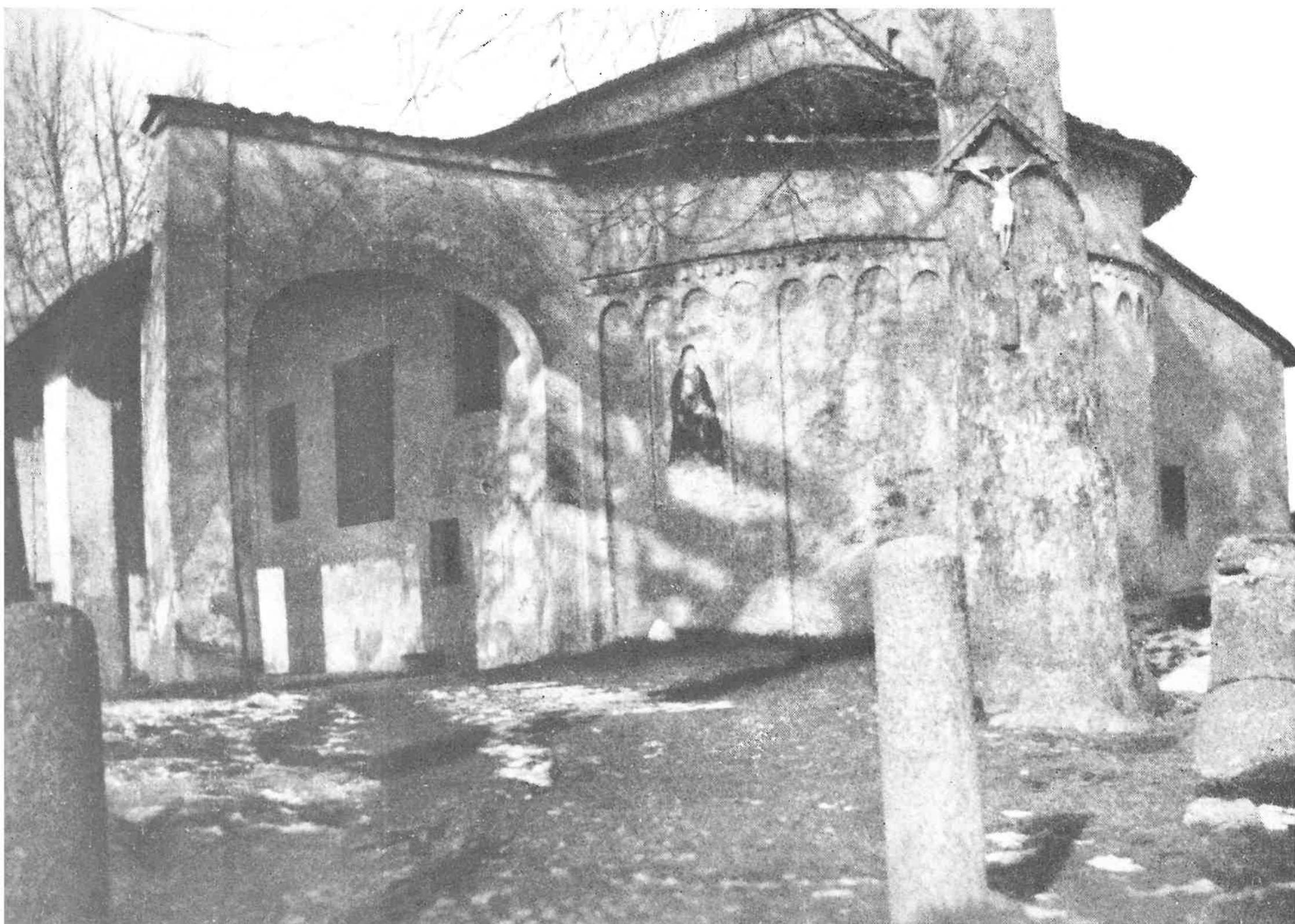
Ingresso all'area della chiesa. Ieri... con il venerato Crocifisso.