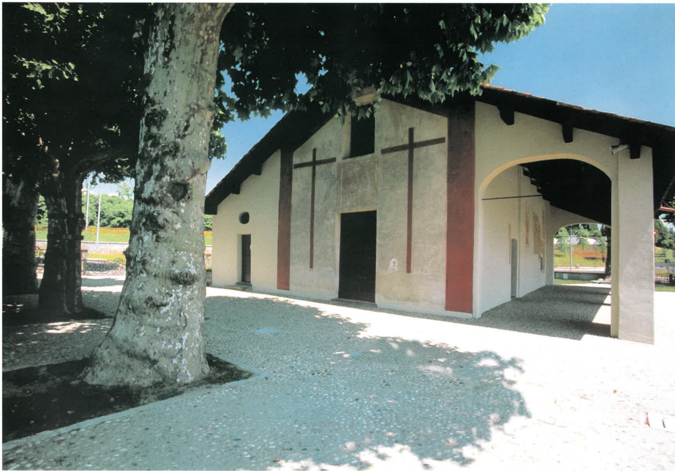
Scorcio delle facciate, con ingresso, rivolto a ovest. Oggi: dopo gli ultimi restauri e l'acciottolato del piazzale.