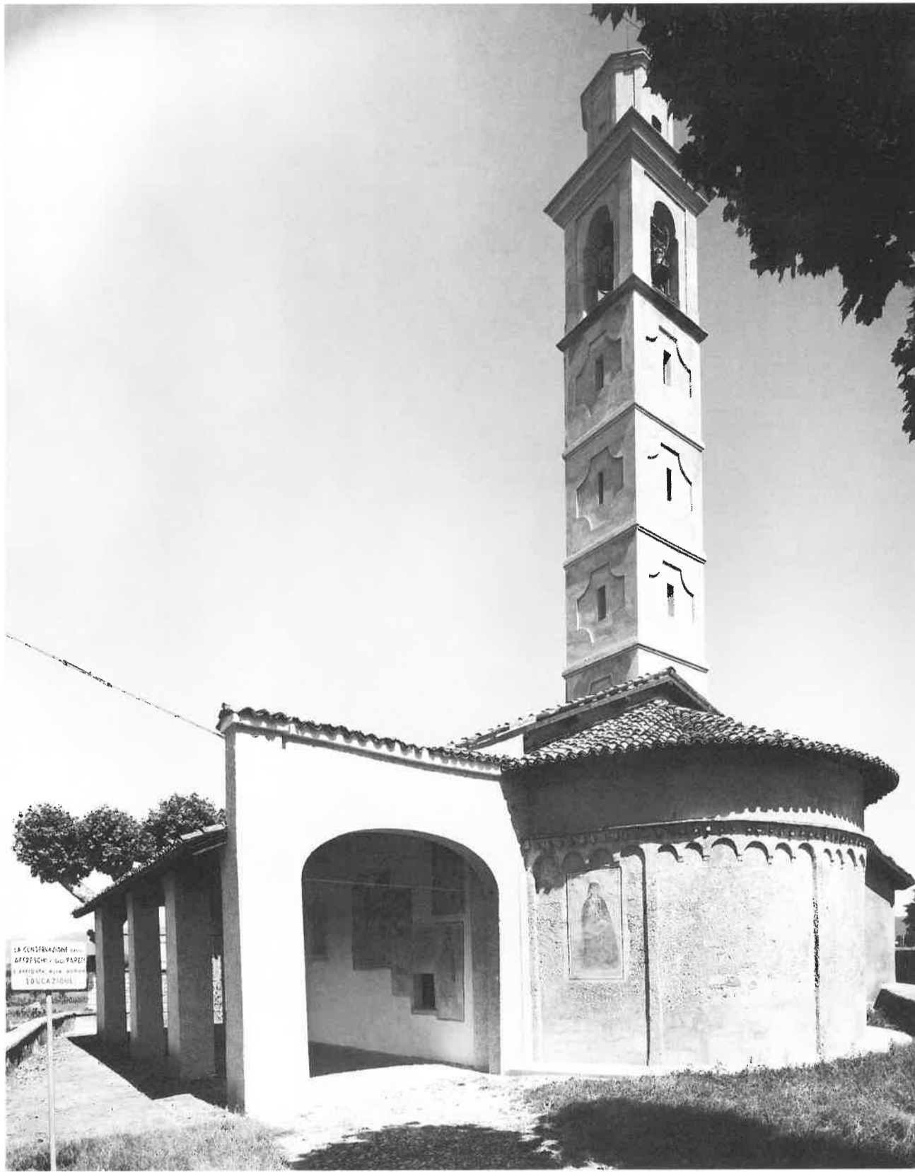
Veduta est con l'abside, il porticato e il settecentesco campanile. Ieri...