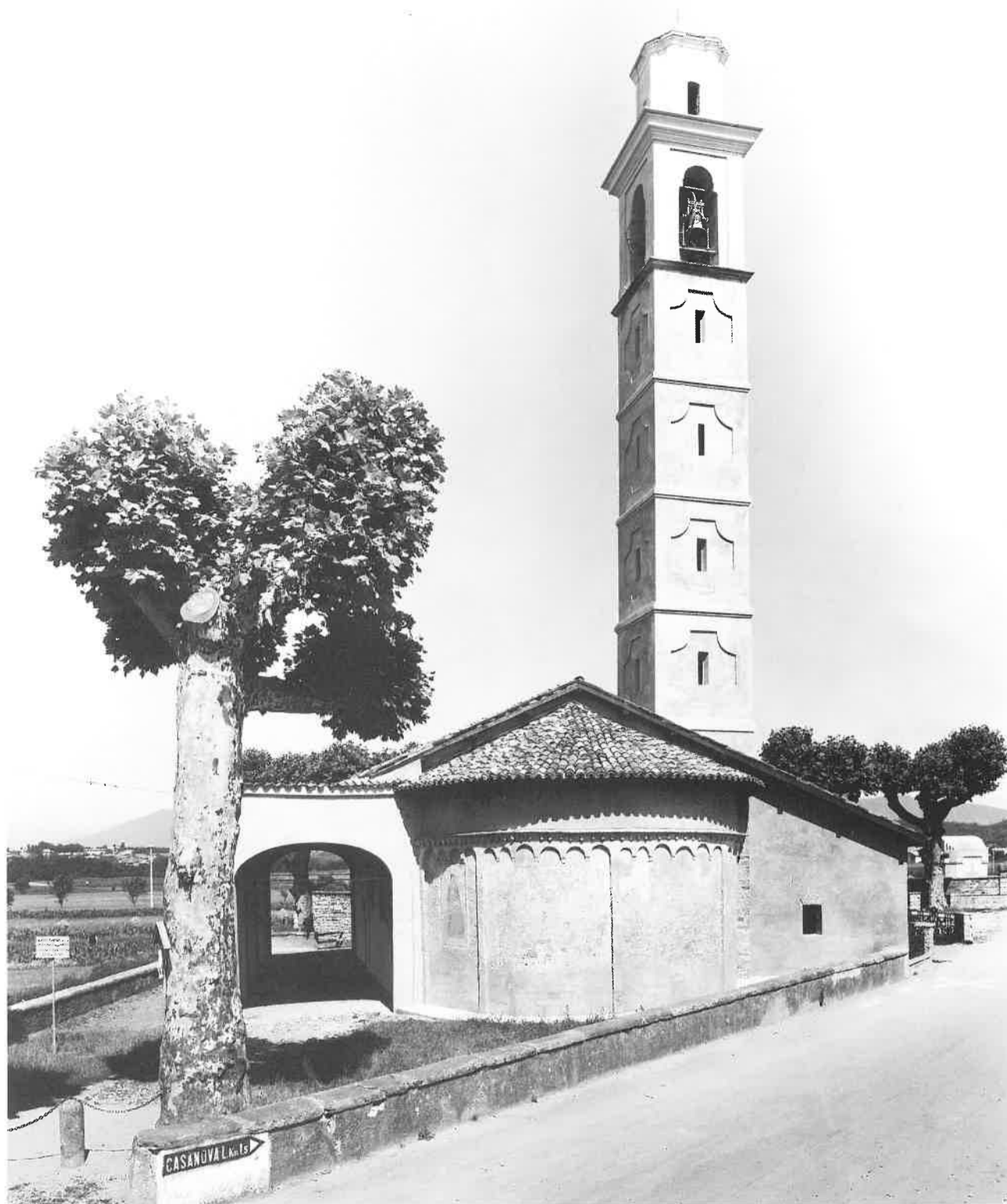
Veduta dell'abside. Ieri: la parte absidale sacrificata dalla strada provinciale.