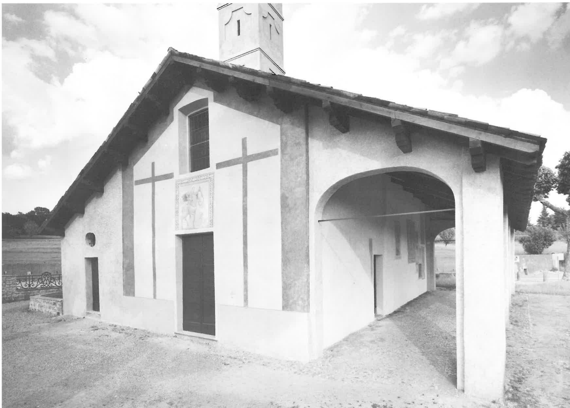
Scorcio delle facciate, con ingresso, rivolto a ovest. Ieri...