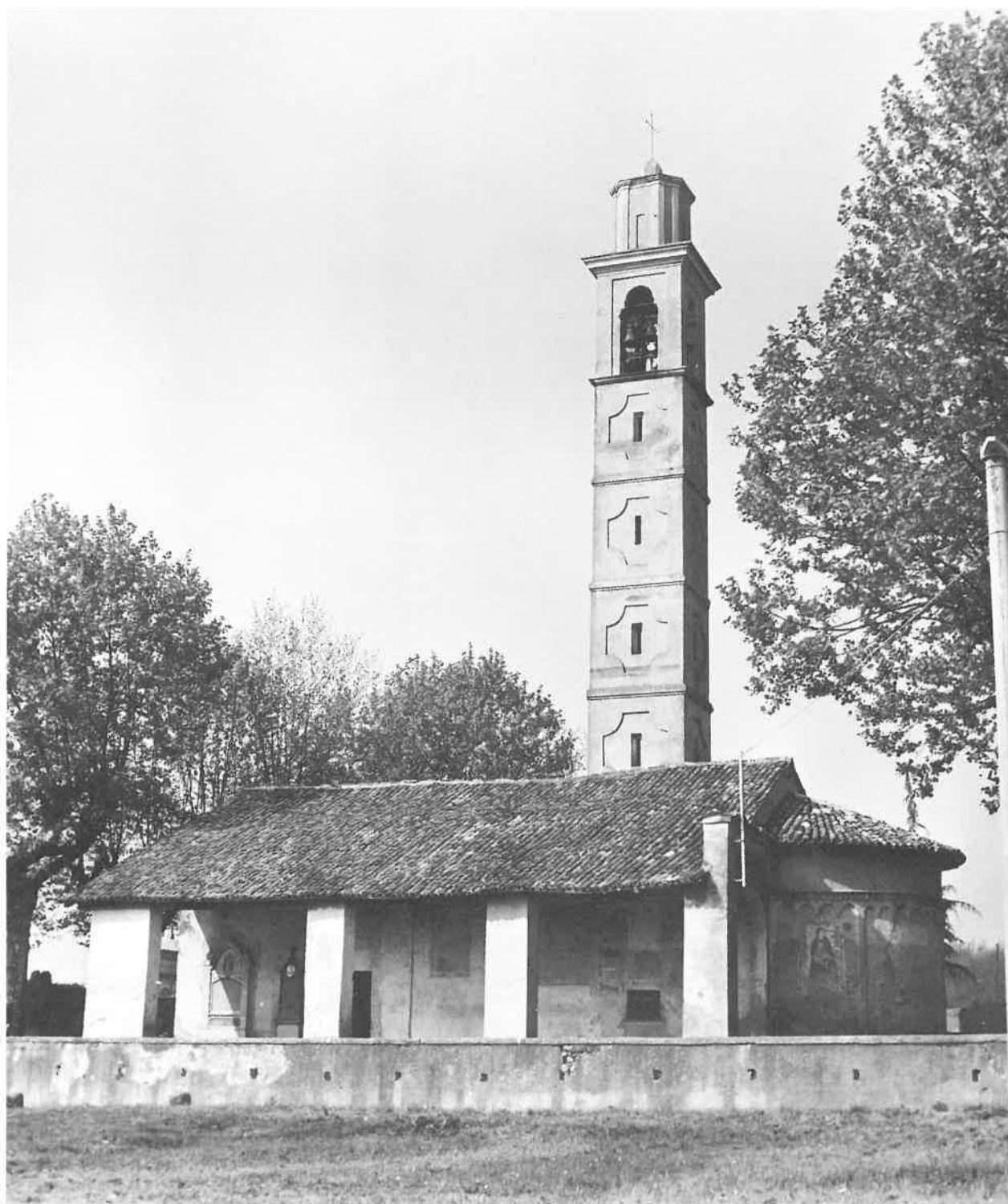
Porticato sud. Ieri...