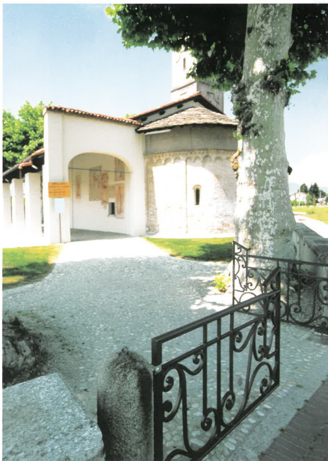
Ingresso all'area della chiesa Oggi: con il nuovo cancelletto.